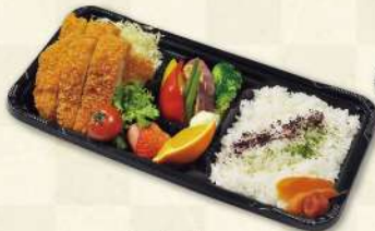
奥豊後 ポークロースカツ(150g)弁当 1,200円(税込)