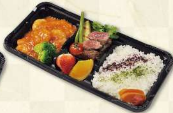
海老のチリソースと 熟成牛サイコロステーキ弁当 1,280円(税込)