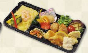
3種の鶏がんまい弁当 1,000円(税込)