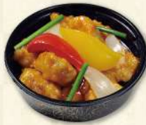
ホテル特製 広東風酢豚 900円(税込)