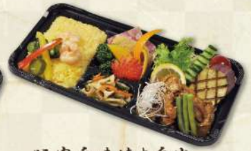
豚肉香味焼き弁当 980円(税込)