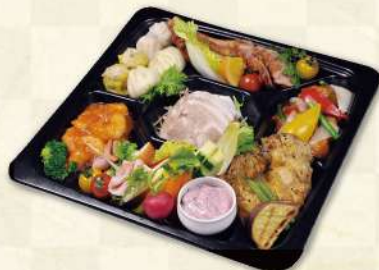
オードブルプレート (3~4名様用) 海老のチリソース 広東風酢豚 ハーブソーセージグリル その他 3,800円(税込)