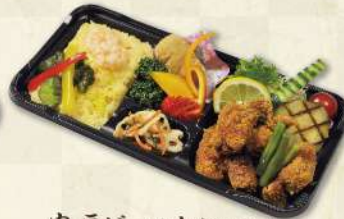
肉厚ビーフカツ(150g) デミグラス弁当 1,350円(税込)