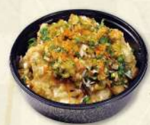
若鶏のフリット 香味油淋ソース 550円(税込)