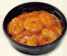
ホテル特製 海老のチリソース 970円(税込)