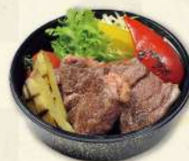
熟成牛サイコロステーキ(150g) グリル野菜添え 1,130円(税込)