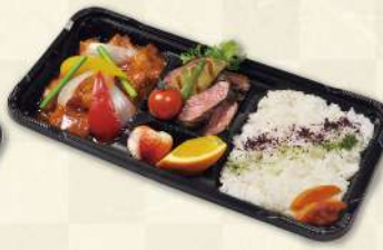
広東風酢豚と熟成牛 サイコロステーキ弁当 1,280円(税込)