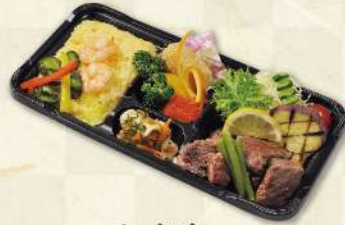
熟成牛 サイコロステーキ(150g)弁当 1,350円(税込)