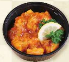
海老のチリソース 1,000円 (税込)