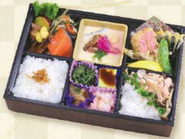
熊八旬菜弁当 1,480円 (税込)