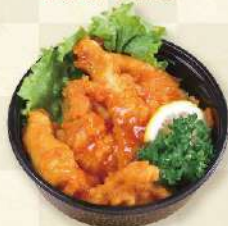
鶏チリソース 700円 (税込)