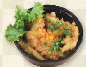
とり天油淋鶏 700円 (税込)