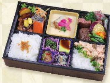
旬菜と熟成牛ステーキ弁当 1,630円 (税込)