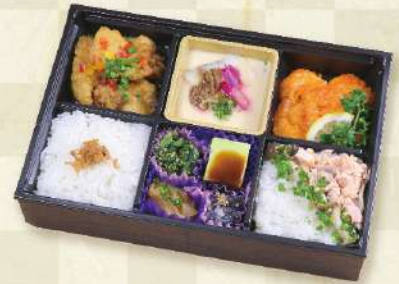
熊八中華弁当 1,630円 (税込)