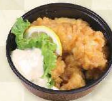
鶏南蛮漬け 700円 (税込)