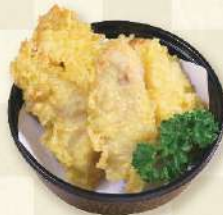
名物とり天 600円 (税込)