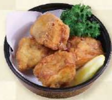
地獄蒸し唐揚げ 600円 (税込)